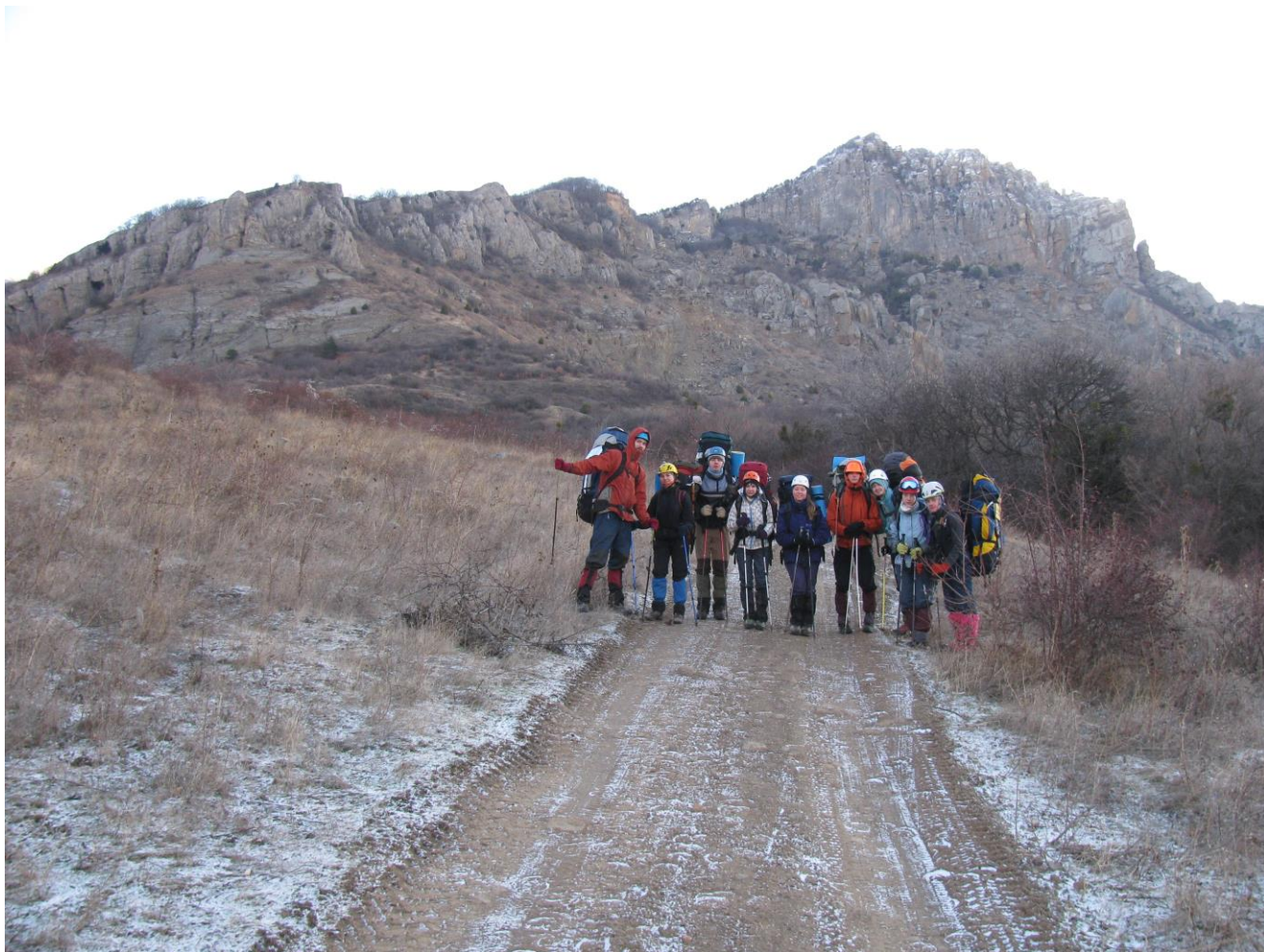
Фото 2 – Група на виходы