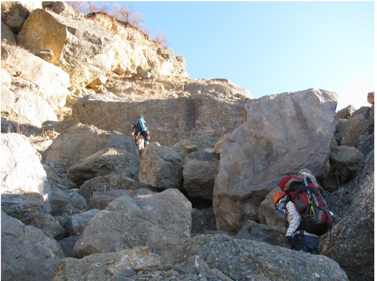
Фото 6 – Рух по великому камінню