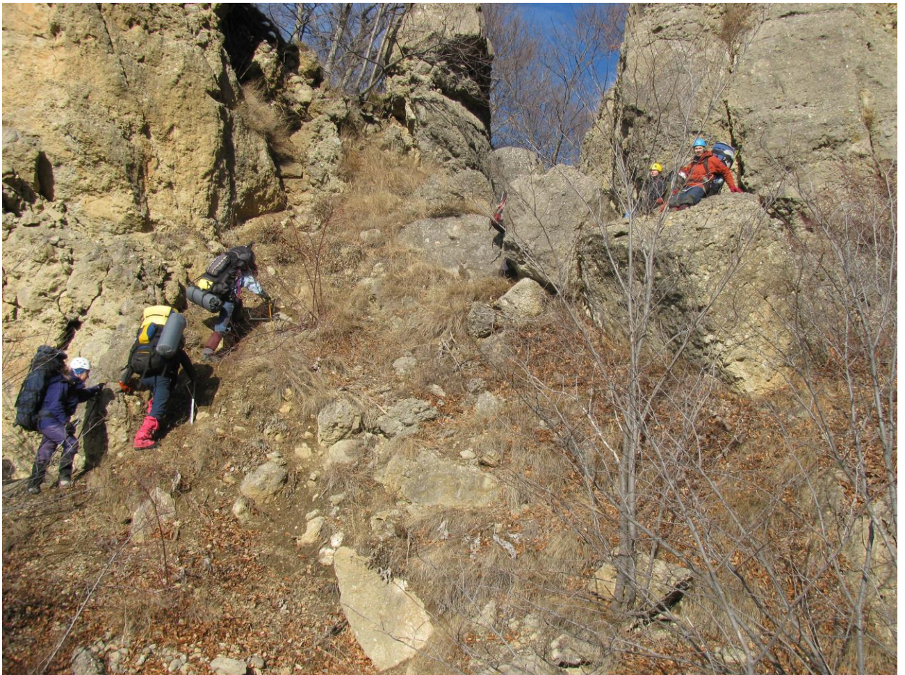
Фото 6 – Вихід на сідловину перевальну