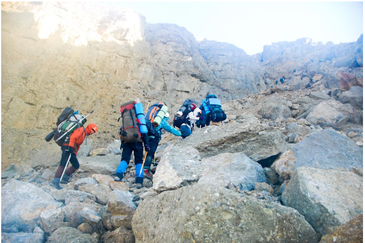
Фото 5 – Рух по мілкому осипу