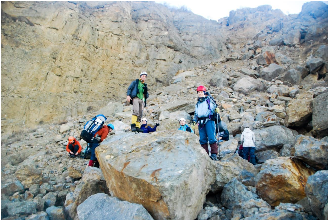
Фото 4 – Група на привалі