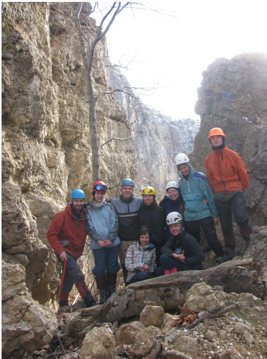
Фото 6 – група на перевалі